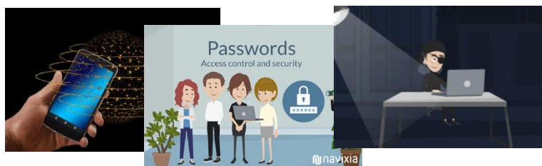
Vidéos et quizzes

Une question? N'hésitez pas à nous contacter via info@navixia.com